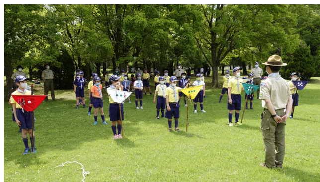
ソーシャル・ディスタンスを確保したカブの集合の様子。