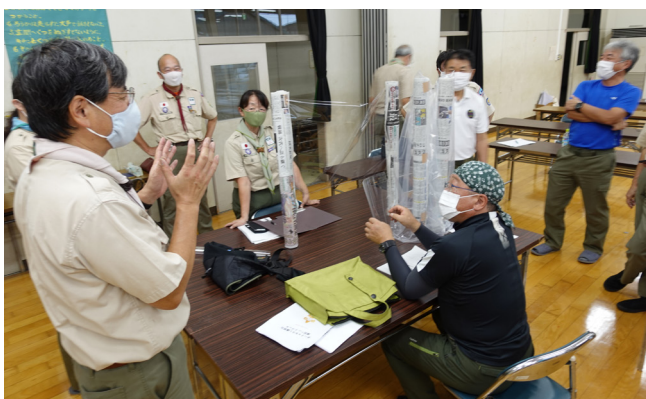
飛沫飛散防止パーティションの研究（トレーニングチーム）