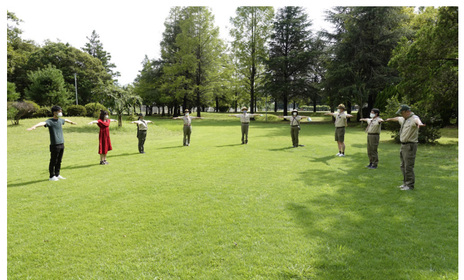
ソーシャル・ディスタンスを確保した集合隊形の研究（トレーニングチーム）